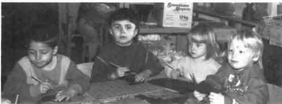
Spielen und Lernen im Kindergarten Pogum